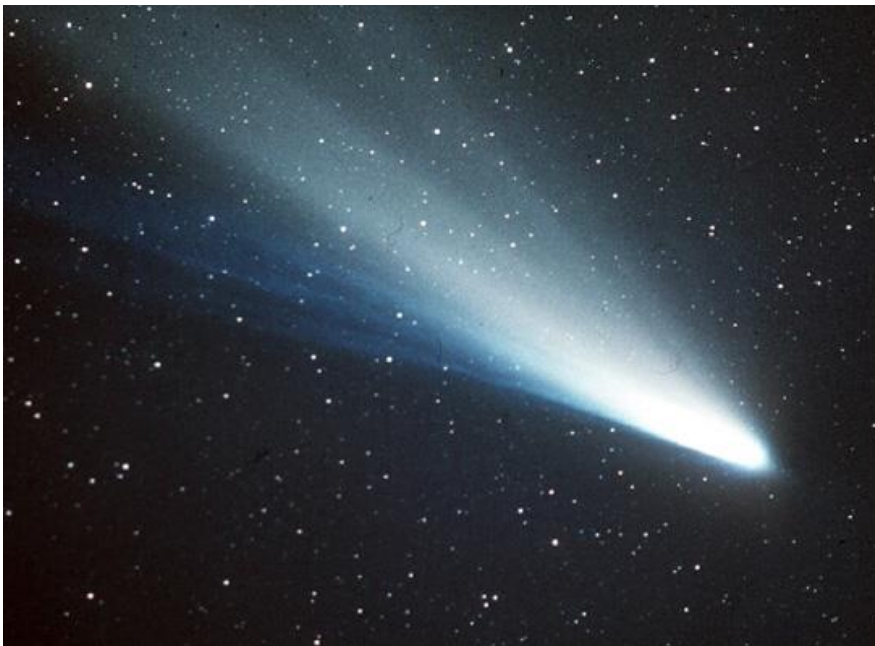
Bild 2: Der Halleysche Komet am 09.03.1976 mit bläulichem Gasschweif und weißem Staubschweif. Der Komet wurde nach dem englischen Physiker Edmond Haley (1656-1742) benannt, der sich um die Bahnbestimmung verdient gemacht hat.

Helle Kometen mit einem langen Schweif haben die Gemüter in allen Jahrhunderten immer tief bewegt. Man deutete sie als Vorboten besonderer Ereignisse. Künstler haben diesen Gedanken aufgegriffen und bei volkstümlichen Krippendarstellungen und in Bildern von der Geburt Christi über dem Stall 2 von Bethlehem einen hellstrahlenden Kometen mit langem Schweif dargestellt.