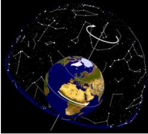
Bild 6: Die Erde dreht sich in 24 Stunden einmal um ihre Polachse. Ihre Drehrichtung ist von West nach Ost gerichtet. Da das Himmelsgewölbe feststeht, habe wir als Beobachter auf der Erde den (scheinbaren!) Eindruck, als würde sich das Himmelsgewölbe von Ost nach West drehen. Anders ausgedrückt: Alle Gestirne gehen im Osten auf und im Westen unter.

ronomisches Gestirn wäre als Reisezeichen für die Weisen geeignet, um sie mehrere Wochen lang tagaus, tagein in westlicher Richtung zu führen, dann unsichtbar zu werden und später über einem speziellen Haus zu scheinen (siehe Kapitel 4).