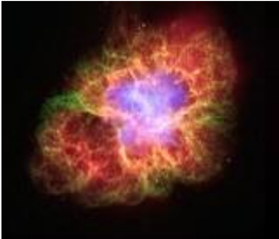
Bild 3: Der Krebsnebel – ein Überrest der Supernova aus dem Jahre 1054. Damals war es der hellste Stern am Himmel; er war drei Wochen lang beobachtbar – auch am Tage. Ein chinesischer Hofastronom hat die Lichterscheinung beschrieben.