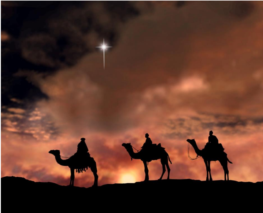
Bild 1: Realistische Darstellung, wie hellerscheinend der Stern von Bethlehem wohl gewesen sein mag. Bezüglich der Anzahl der Weisen siehe Kapitel 7.

(Image from the fulldome show „Mystery of the Christmas Star“, produced by Evans & Sutherland)